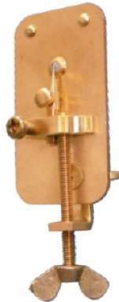
単眼式顕微鏡 (約200倍)