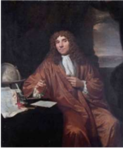
レーウエンフック 議会の管理官、 測量士、ワイン計量官 1632~1723

1674 Antony van Leeuwenhoek オランダ 自作の顕微鏡で池の水に微小生物を発見